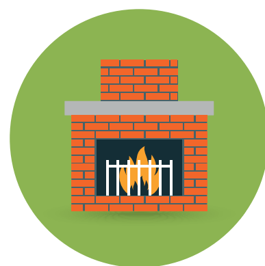
Vizes hőcserélős kandalló.